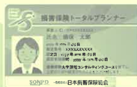
顔写真付き認定証イメージ

顔写真付き認定証・認定バッジを使用できます。また「損害保険トータルプランナー」という称号と、シンボルマークを名刺等に使用できます。