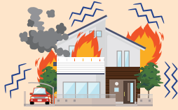
地震により 火災 が発生し家が焼失した