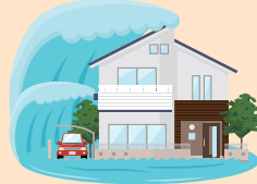
津波により家が流された