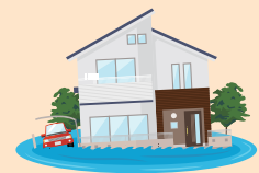
液状化により建物が傾いた (または沈下した)