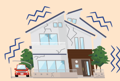
地震により家が倒壊した