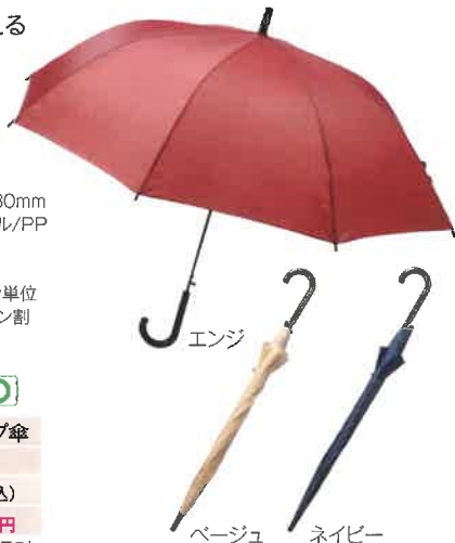
エンジ ベージュ ネイビー