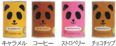
キャラメル コーヒ- ストロベリー チョコチップ