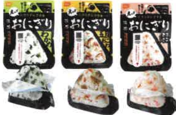
わかめ 五目おこわ 鮭