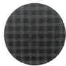
ビニール傘に見えない高級感